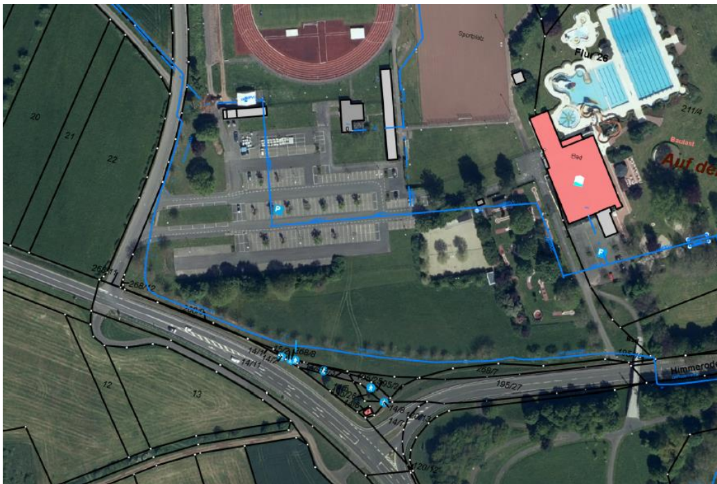
Abbildung 1: Verlauf bestehender Wasserleitungen (blaue Linien)

Das Thema wird im Rahmen der Planumsetzung berücksichtigt und eine Abstimmung mit den Stadtwerken Wittlich vorgenommen, sofern solarthermische Anlagen im Nahbereich der Bestandsleitungen geplant werden.