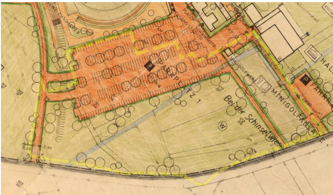
Abbildung 4: Überlagerung Ursprungsbebauungsplan und Geltungsbereich der 1. Änderung (gelbe Linie)

Infolge der gewählten Geltungsbereichsabgrenzung im Süden ragt der Änderungsbereich beim Einmündungstrichter der Himmeroder Straße in die Kreisstraße spornartig leicht über die den Geltungsbereich des Ursprungsbebauungsplans heraus. Wegen Geringfügigkeit dieser Flächengröße ist die Änderung des Bebauungsplans auch im Rahmen des § 13 a BauGB möglich.