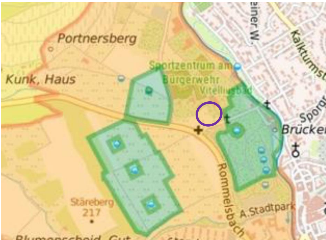
Abbildung 5: Neuabgrenzungsentwurf WSG (grüne Umrandung Zone II, orange Umrandung Zone III)

Der Geltungsbereich der 1. Änderung liegt räumlich im vorgesehenen Wasserschutzgebiet, WSG 100 Stareberg-Seiberich, amtl. Nr. 405110163 innerhalb der nunmehr abgegrenzten Schutzzone III B (weitere Schutzzone).