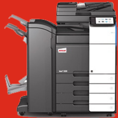
Multifunktionsgeräte A4 - A3, Softwarelösungen

Molter Bürosysteme wünscht frohe Weihnachten und einen guten Rutsch ins neue Jahr!